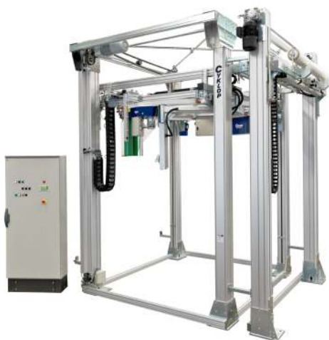
Owijarka GL 2000 z podajnikiem ITF